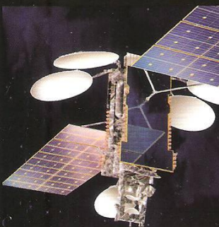
VENEZUELA ENTRA EN ORBITA Venesat-1 contribuirá a la masificación de las comunicaciones en Latinoamérica.